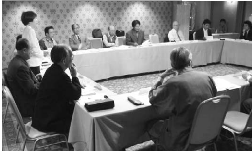
第1回理事会（平成15年4月19日）